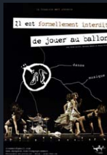
Il est formellement interdit de jouer au ballon