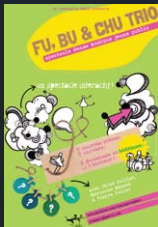
Fu, Bu & Chu Trio jeune public